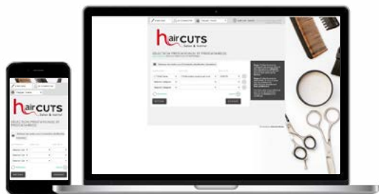
THÈME 1 Hairdresser

Choisissez le thème e-RDV qui correspond à votre l'ambiance. Nous pouvons aussi réaliser un thème personnalisé (190€ HT), pour plus de renseignements contactez- nous au 02 40 03 18 98.