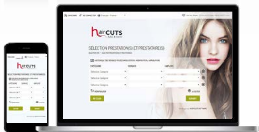
THÈME 2 Natural