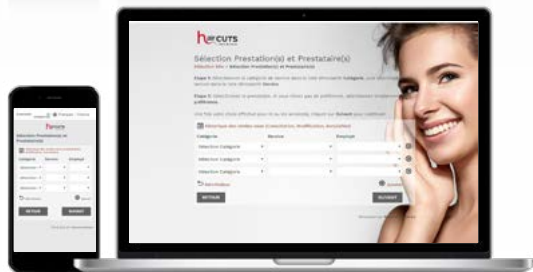
THÈME 3 Smile